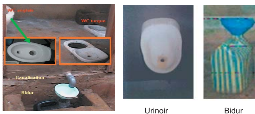
A : Collecte d'urine

Ainsi, chaque ménage bénéficiaire de latrines ECOSAN était-il exposé aux séances de sensibilisation de proximité pour la gestion des ouvrages.